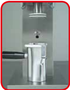
Formeinsätze aus Aluminium Anticorodal. Spaghettiform serienmäßig