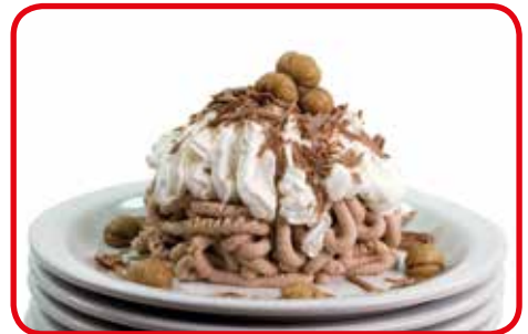
Eiskreation mit dem Formeinsatz "Spaghetti"