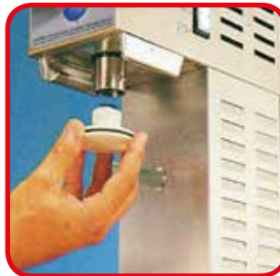
Der Druckkolben aus Makrolon® ist einfach zu entfernen für eine perfekte Reinigung