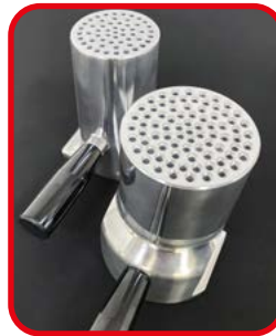
Neue Form "3 Kugeln"