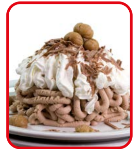
Eiskreation mit dem Formeinsatz "Spaghetti"