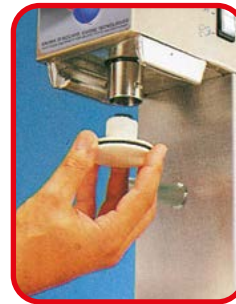
Der Druckkolben aus Makrolon® ist einfach zu entfernen für eine perfekte Reinigung