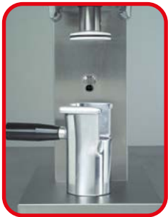
Formeinsätze aus Aluminium Anticorodal. Spaghettiform serienmäßig