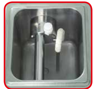
Wanne mit direkter Kühlung