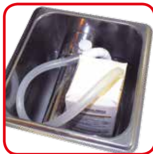
Es ist möglich, die Pumpe auf der Verpackung der Sahne direkt zu aufhängen