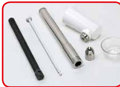
Die Komponenten des Abschlusssystem sind ganz zerlegbar für eine sehr gute Sauberkeit